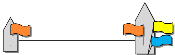
LÍNEA DE SALIDA